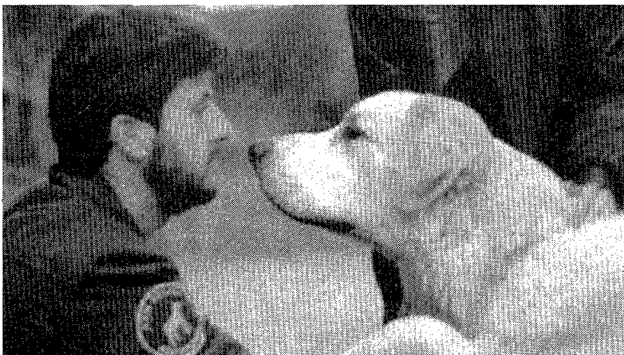
A menudo olvidamos que cada perro tiene una personalidad distinta